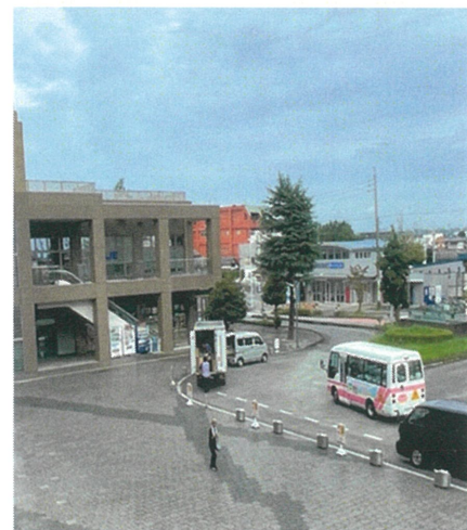
外観・備品・浜北駅前ロータリー写真